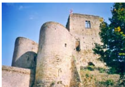
Eglise et château de Semur en Brionnais