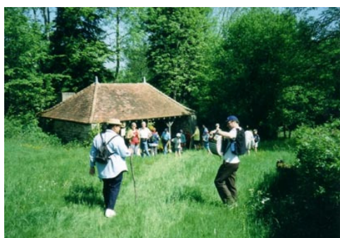
Lavoir de Jonzy