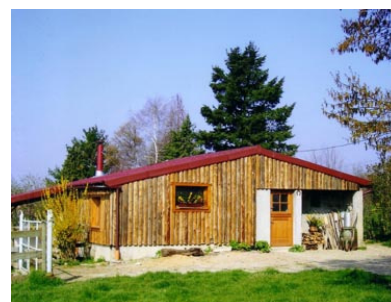
Gîte du coq à l'âne