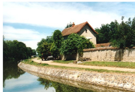
ancien relais de ravitaillement de chevaux et ânes le long du canal